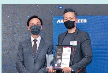
▲ 銀行科技 金獎 環聯資訊有限公司