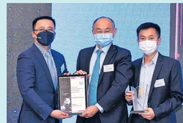
▲ 監管科技 白金獎 優利佳金融科技有限公司