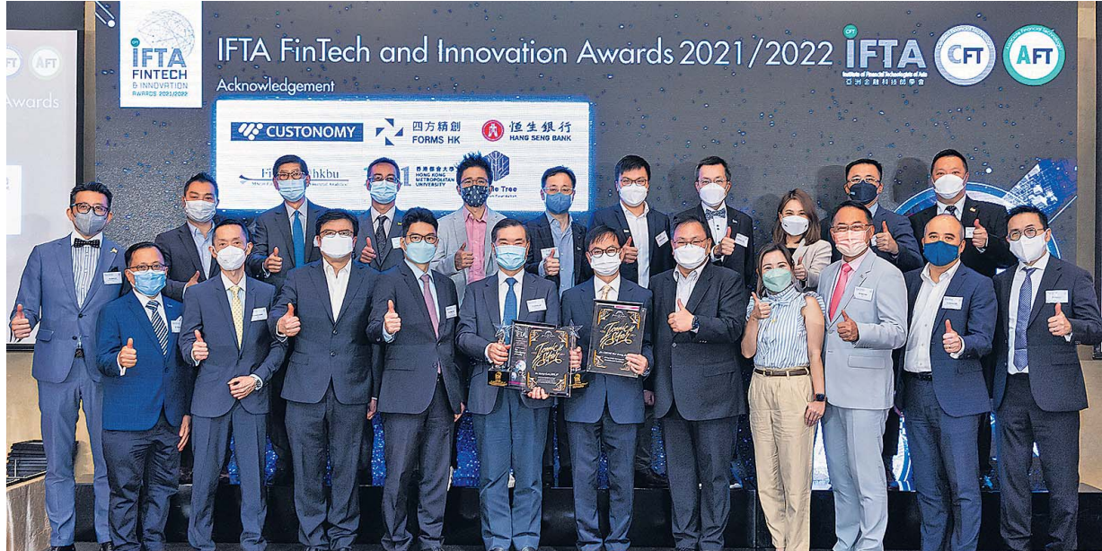
▲ 亞洲金融科技師學會 (IFTA) 舉辦的「2021-2022年度IFTA金融科技創新大獎」頒獎典禮，今年共頒發了22個企業成就獎及15個個人及團隊獎項，表揚不同的科技人才的出色表現和成就。

他又指出，現已進入Web 3.0，希望這個世代的人能夠更具創造力，因共同創造已逐漸成為主流，當中NFT大流行可推動創作者的創作發展及帶來更多好處，例如智慧型合約能自動轉換作品價