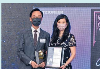
▲ 區塊鏈、加密貨幣和CEP (加密貨幣交易供應商) 白金獎 利嘉閣地產