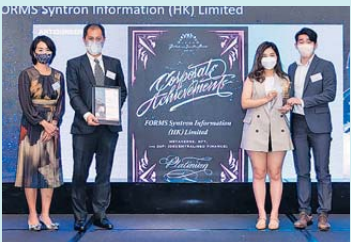
▲ 元宇宙，非同質化代幣 (NFT)，去中心化金融 (DeFi) 白金獎 四方精創資訊 (香港) 有限公司