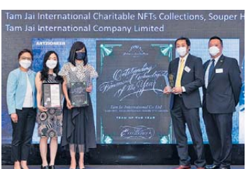
▲ 年度團隊 卓越獎 譚仔國際有限公司 譚仔國際慈善NFT系列「Souper Hero」