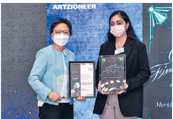
▲ 年度團隊 卓越獎 Merkle Tree Innovation Foundation