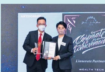
▲ 財富科技 金獎 昶科