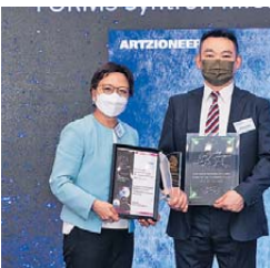
▲ 年度團隊 優異獎 Architecture and Development Practice