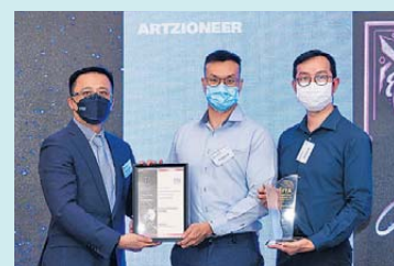
▲ 監管科技 鑽石獎 燃希有限公司