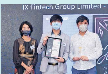
▲ 元宇宙，非同質化代幣 (NFT)，去中心化金融 (DeFi) 金獎 互通金融科技集團有限公司—得利通 (數字科技研究) 有限公司