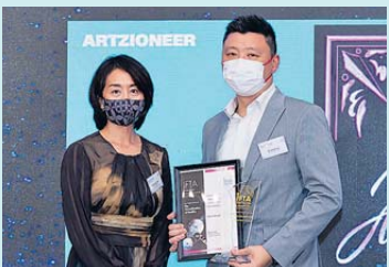
▲ 人才發展 鑽石獎 友邦保險 (國際) 有限公司