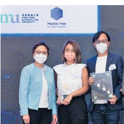
▲ 年度團隊 優異獎 環聯資訊有限公司