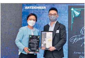
▲ 年度團隊 卓越獎 四方精創資訊 (香港) 有限公司 Digital Experience Practice