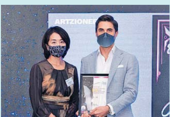
▲ 元宇宙，非同質化代幣 (NFT)，去中心化金融 (DeFi) 白金獎 Evident