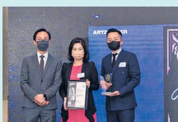
▲ 銀行科技 金獎 恒生銀行