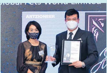
▲ 元宇宙，非同質化代幣 (NFT)，去中心化金融 (DeFi) 銀獎 環球寵物世界有限公司