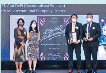
▲ 元宇宙，非同質化代幣 (NFT)，去中心化金融 (DeFi) 白金獎 譚仔國際有限公司