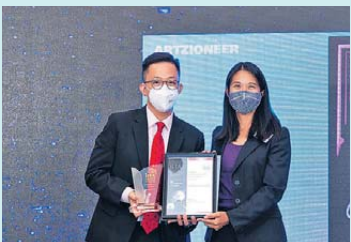
▲ 財富科技 金獎 智學資本有限公司