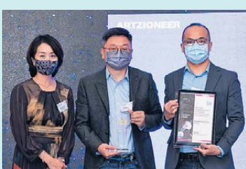
▲ 元宇宙，非同質化代幣 (NFT)，去中心化金融 (DeFi) 白金獎 Customomy Company Limited