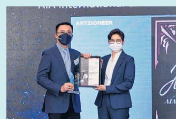
▲ 保險科技 金獎 友邦保險 (國際) 有限公司—3D Protection Index