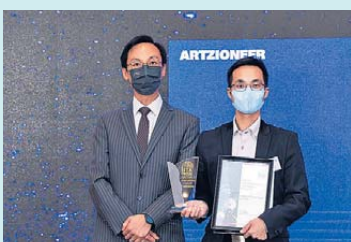
▲ 銀行科技 銀獎 創意世紀科技有限公司