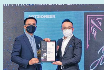
▲ 保險科技 金獎 友邦保險 (國際) 有限公司—SMP iSay