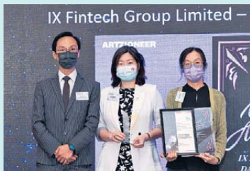
▲ 區塊鏈、加密貨幣和CEP (加密貨幣交易供應商) 金獎 互通金融科技集團有限公司—得利通 (數字科技研究) 有限公司