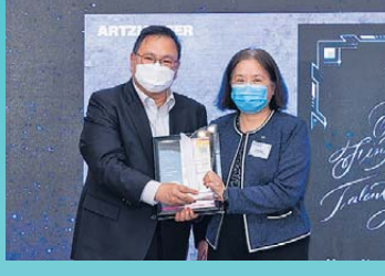
▲金融科技教育與人才發展 鑽石獎 香港都會大學