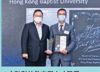
▲金融科技教育與人才發展 鑽石獎 香港浸會大學金融(金融科技及金融分析)理學碩士