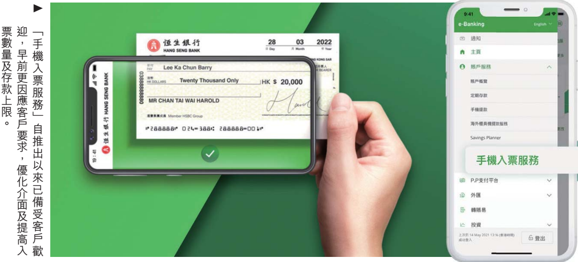
「手機入票服務」自推出以來已備受客戶歡迎，早前更因應客戶要求，優化介面及提高入票數量及存款上限。

無縫的數碼理財體驗。同時積極與不同的技術及初創公司合作，透過API對接，令銀行服務走入客戶生活圈，讓客戶於第三方平台都可方便快捷地使用各種銀行服務。」