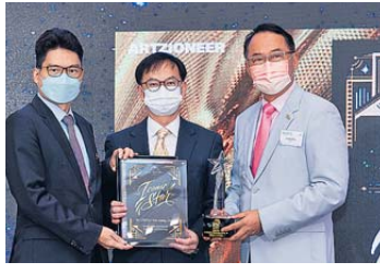
▲前創新及科技局副局長鍾偉強博士