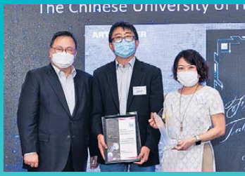
▲金融科技教育與人才發展 鑽石獎 中大工程學院金融科技應用研究院